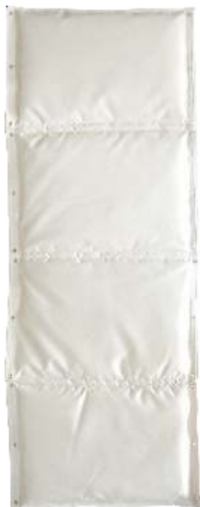
2) 0,40m (Π) x 1,20m (Υ)