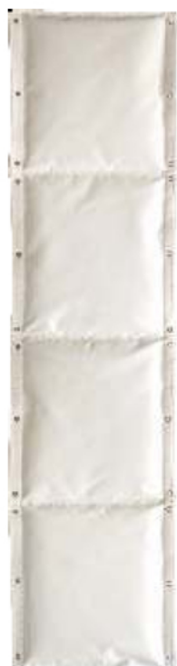
1) 0,25m (Π) x 1,20m (Υ)